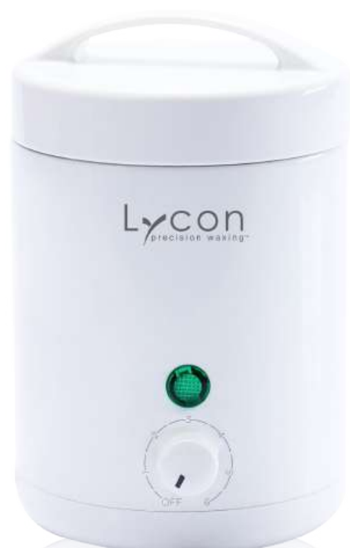
Нагреватель для воска