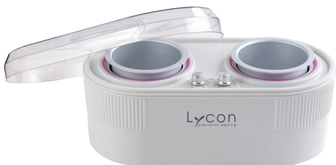
Нагреватель для воска